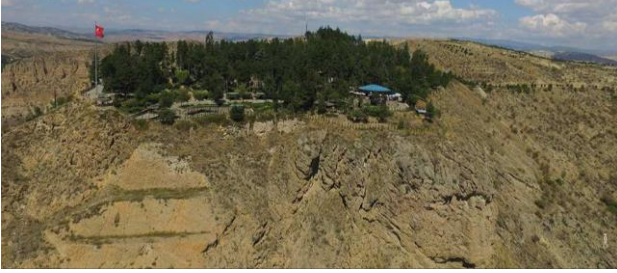
Şekil 4. Çankırı Kalesinin konumu ve çevresi

Çankırı'ya hâkim küçük bir tepe üzerinde yer alan kalede 2012 yılında Kültür ve Turizm Bakanlığının da katkılarıyla Çankırı Belediyesi tarafından çevre düzenlemesi çalışmaları yapılmış ve kaleyi ziyaret edenlerin sosyal ihtiyaçlarını karşılayacak kullanımlar oluşturulmuştur (Şekil 4). Özel araç ile ulaşılabilen kalede otopark, oturma yerleri, çok sayıda pergole, mescit ve tuvalet bulunmaktadır (Çankırı Valiliği, 2020).