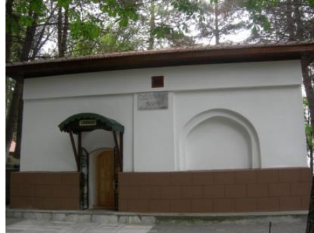
Şekil 3. Çankırı Kalesi ve Emir Karatekin Bey Türbesi