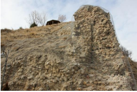
Şekil 2. Çankırı Kalesi surları (Çankırı Belediyesi, 2016)