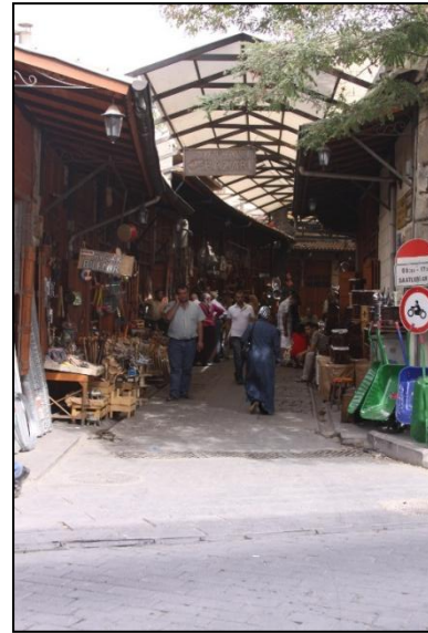
Fotoğraf 4. Yenilenen Bakırcılar Çarşısı ve Haphapçı Pazarı (K TOPÇU, 2010)

Yapılan tüm bu çalışmalar, çarşının yeniden kazanılması, sağlıklılaştırılması, canlandırılması adına oldukça önemli gelişmelerdir. Sokak sağlıklılaştırması, altyapı yenilemeleri gibi alansal uygulamalar dışında Gaziantep geleneksel çarşısı bütününde noktasal bir takım restorasyon çalışmaları da gerçekleştirilmiştir (Fotoğraf 5, 6, 7, 8).