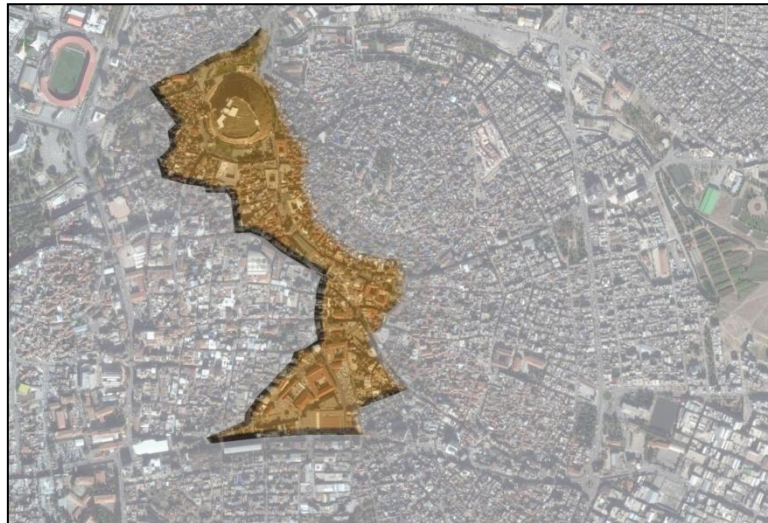
Şekil 1. Gaziantep Geleneksel Çarşısı'nın kent içi konumu ve kale çevresindeki gelişimi (K TOPÇU, 2015)