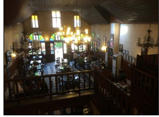
Fotoğraf 8. Tarihi Tahmis Kahvesi, iç mekândan görünüm

Tarihsel değeri olan kültür varlıklarının tek tek korunuyor olması, daha önce de bahsedildiği üzere, geleneksel çarşılar için güçlü bir olanak, fiziksel-mekânsal sürdürülebilirlik açısından olumlu bir girişim olmasına karşın, bu tür yenilemelerin çevresiyle birlikte düşünülmemesi, çarşı bütünlüğü içerisinde görsel anlamda birbirinden kopuk alanların oluşmasına neden olabilmektedir. Çarşığı tek tek yapı bazında ele almak yerine, çevresiyle birlikte bütüncül anlamda düşünülme, sürdürülebilirliği ve mekânın başarısı açısından da önemli bir adım olacaktır kanaatindeyiz.