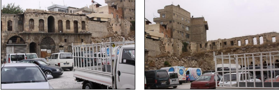
Fotoğraf 3. Gaziantep Geleneksel Çarşısı'nda gözlemlenen sorunlara örnek fotoğraflar (K TOPÇU, 2010)

Bu tür sorunların yanı sıra, alanın mevcut olanaklarını değerlendiren olumlu bir takım girişimler de söz konusu olmuştur. Bu denli eski ve köklü bir geçmişe sahip olan Geleneksel Gaziantep Çarşısı'na hak ettiği ilgiyi yeniden kazandırmak, kentteki zengin birikimi bütünsel bir yaklaşımla gün yüzüne çıkarmak ve geçmişten gelen kültürel birikimin geleceğe aktarılması adına, önemli bir bölümü Gaziantep Büyükşehir Belediyesi - ÇEKÜL Vakfı işbirliği ile tamamlanan 'Kültür Yolu' adı altında oldukça önemli bir proje üretilmiştir (Şekil 2).